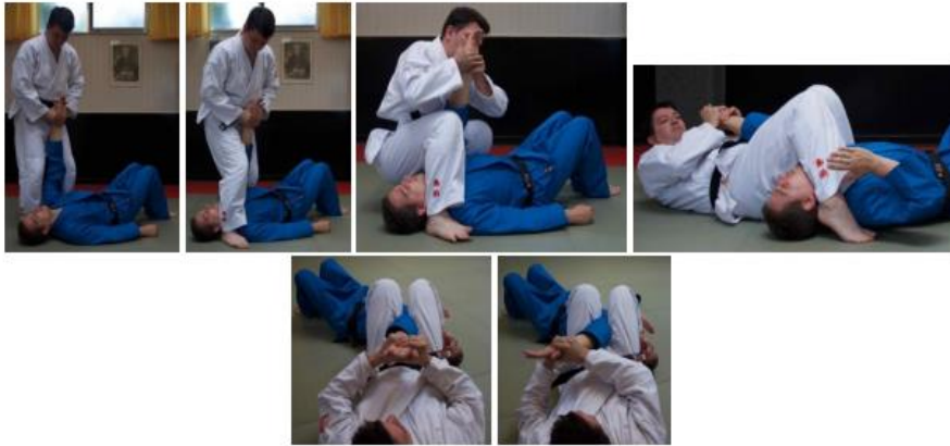
Figuur 45: Juji Gatame